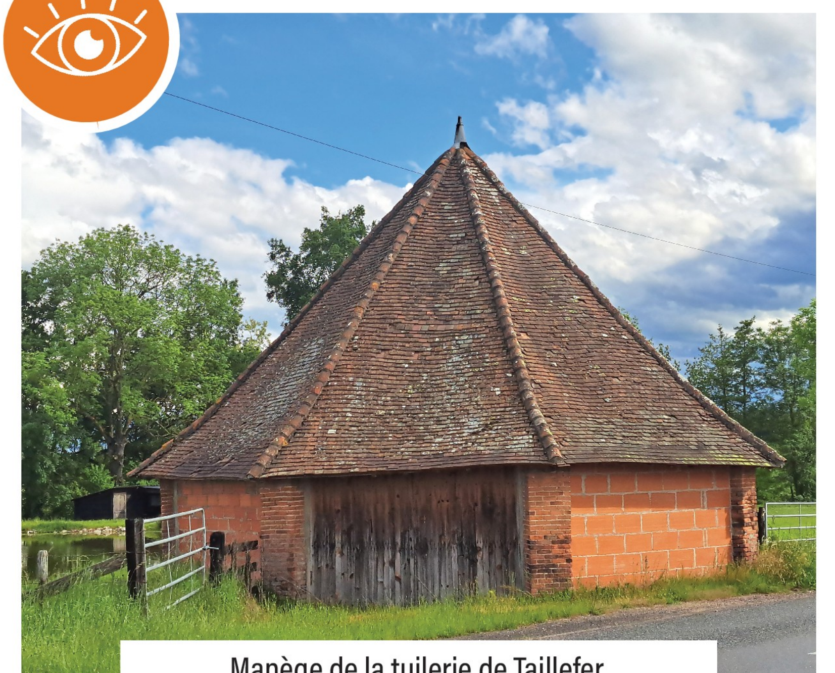
Manège de la tuilerie de Taillefer, au lieu dit Filerin, à Saint-Germain-Lespinnasse