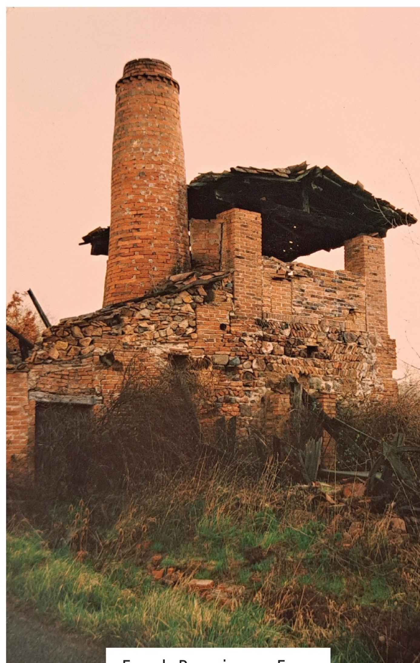
Four de Pommiers-en-Forez