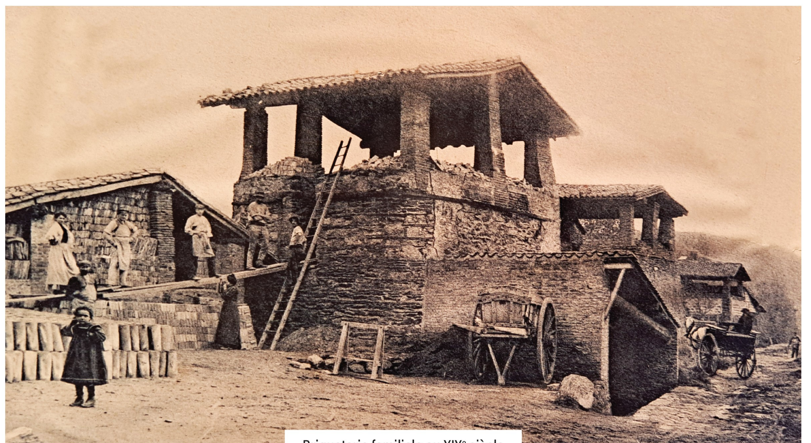
Briqueterie familiale au XIX e siècle

- Robert Bouiller, Inventaire des tuileries et briqueteries du Roannais -