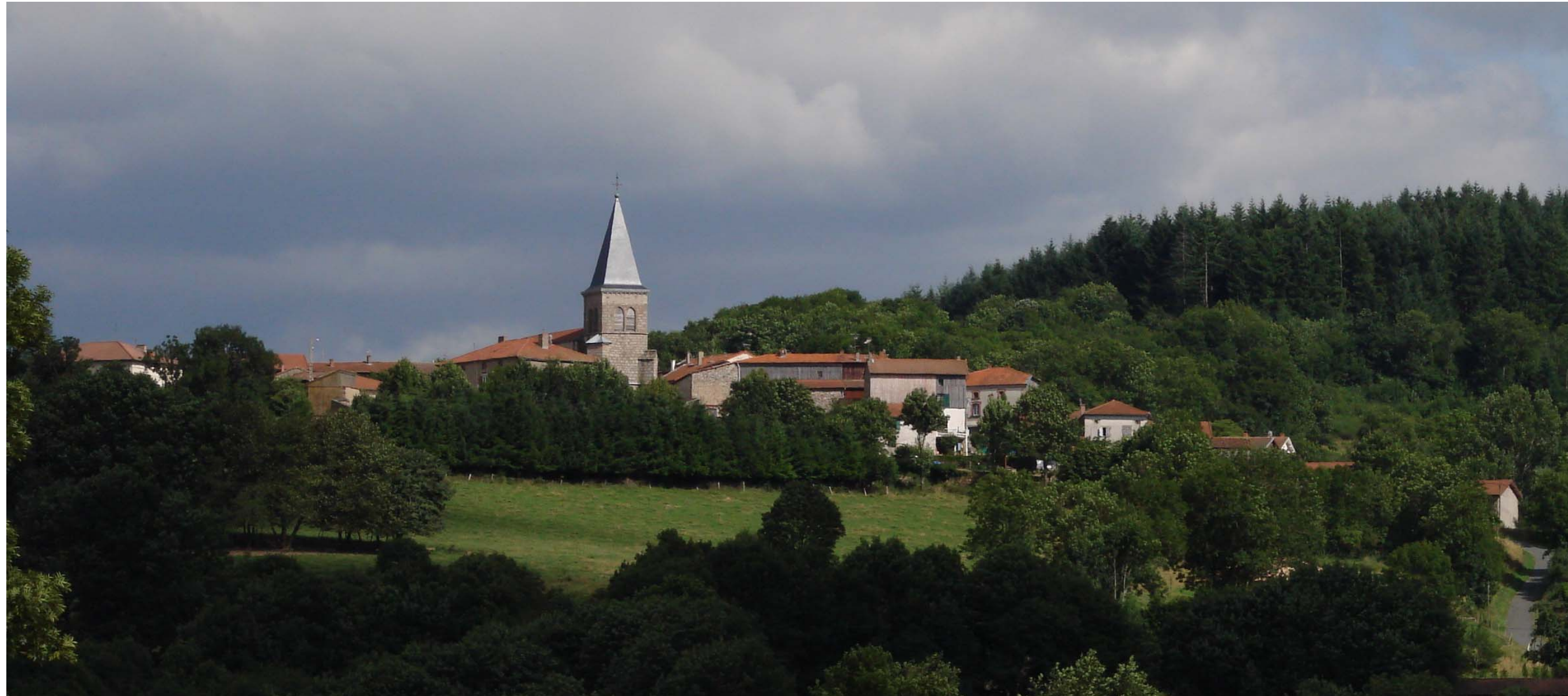
Le bourg de Saint Romain d'Urfé (42)