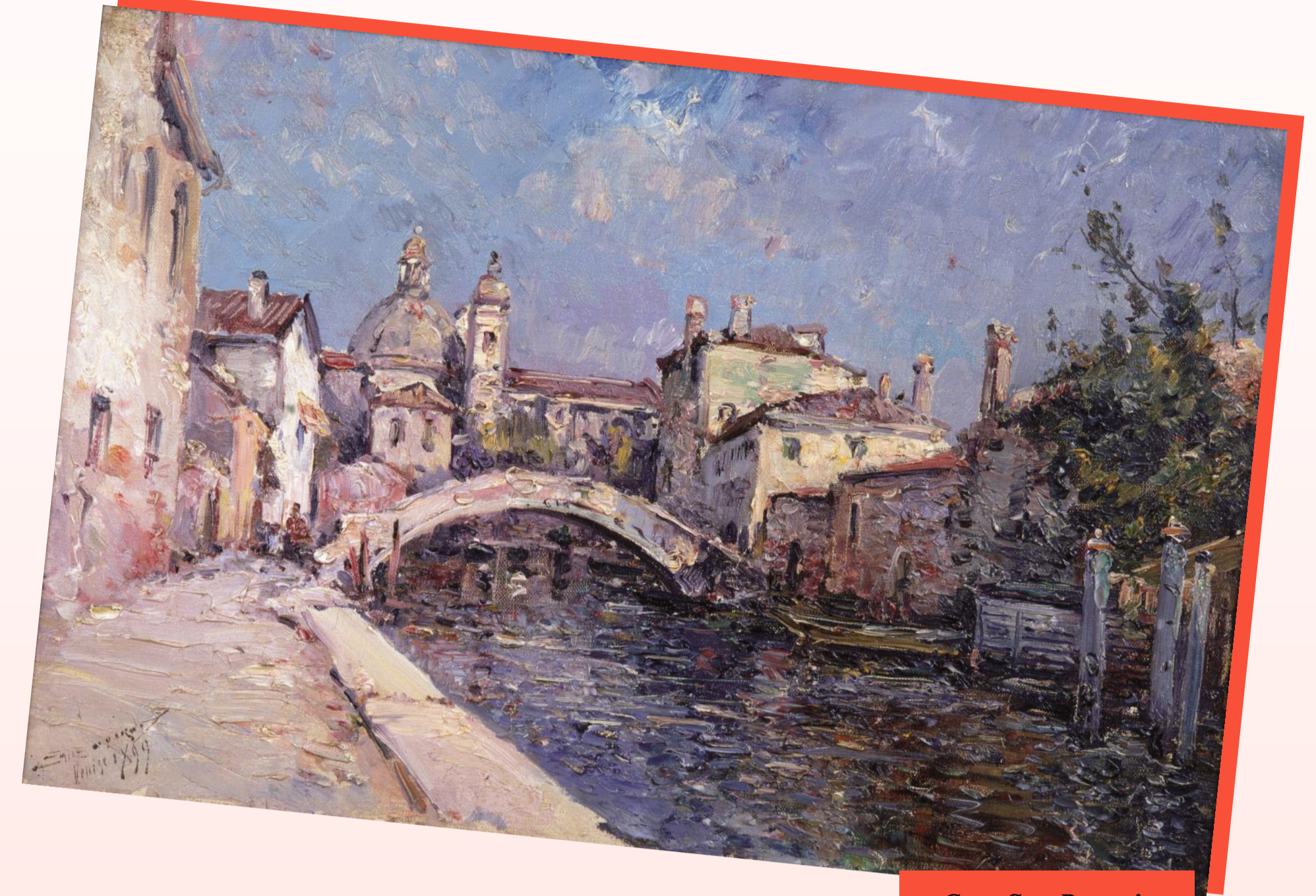
Casa San Protasio Venise huile sur toile Emile Noirot

François-Xavier NOIROT ° 08.03.1783 à Neuf-Brisach (68) + 08.02.1839 à Guebwiller (68) Boulangier x 13.04.1809 à Neuf-Brisach (68) Marie-Anne GIROY