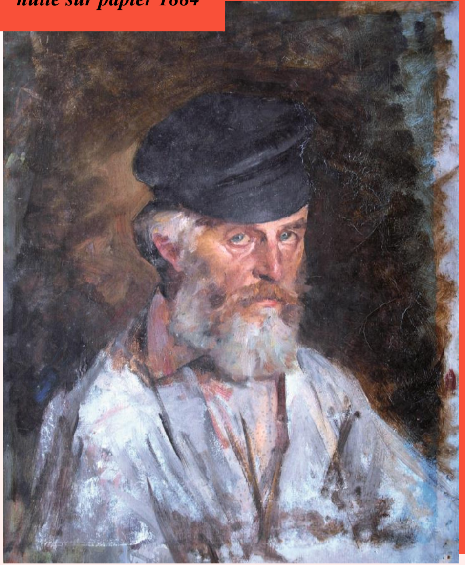
Portrait de Louis par Léon Mignen huile sur papier 1884